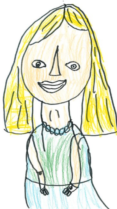
Lučka Postružin, ravnateljica vrta